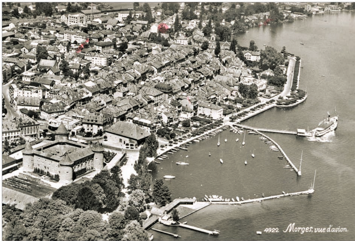
4922 Morges, vue d'avion.